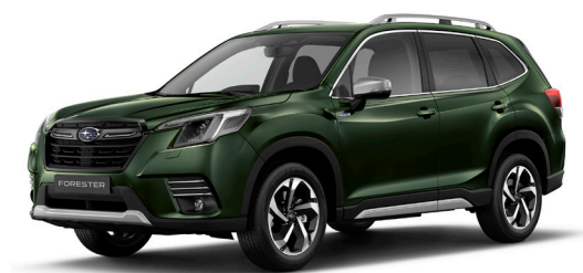
Cascade Green Silica