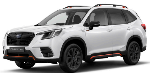
Crystal White Pearl